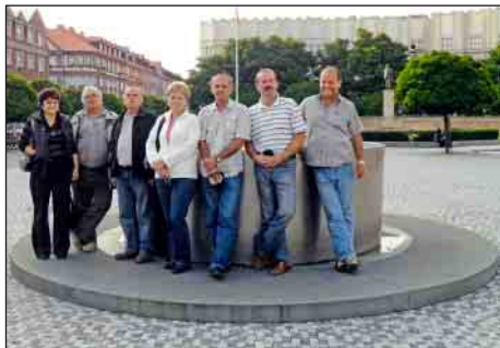
Pri prehliadke Hradca Kráľové

Po oficiálnom privítaní nasledovala slávnostná večera z diviny farmy rodiny Daškových.