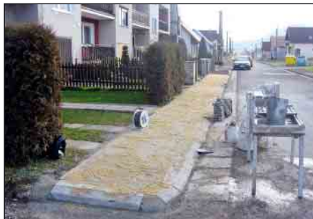
Oprava chodníka na Magdolinej skale