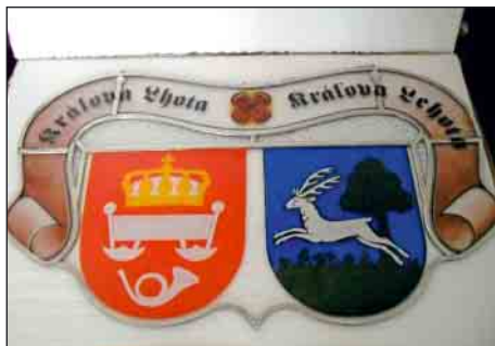
Sklenené erby oboch obcí