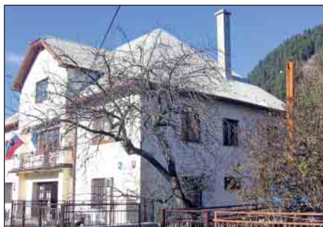
Stavba komína sa robila z výsuvnej plošiny