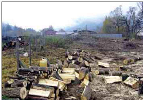
Výrub krovin v mieste nového ihriska

nené korene jestvujúcich stromov a plocha upravená ako podklad pre hokejové ihrisko pre mládež a strednú generáciu počas tejto zimy, pokiaľ budú vhodné klimatické podmienky. V jarných mesiacoch je potrebné previesť preložku plynovodnej prípojky, ktorá ide krížom cez jestvujúce parcele do firmy NOVA BioTerm a po schválení predloženej žiadosti v rámci opatrenia 3.1.2 Základné služby pre vidiecke obyvateľstvo cestou MAS Horný Liptov začať s realizáciou stavebných prác, kde oprávnené výdavky na projekt sú vo výške do 20 000,00 EUR a DPH platí žiadateľ (obec).