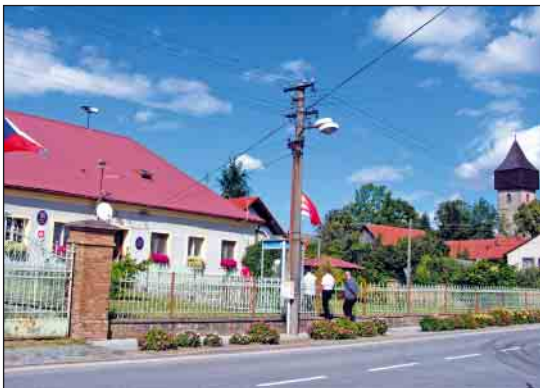
Obecný úrad Králova Lhoty, vpravo kostol sv. Žigmunda