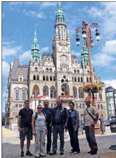
Pred radnicou v Liberci

Trasy našich výletov z Královej Lhoty boli často dlhé, tak sme si z mikrobusu pozerali krajinu, ktorou sme prechádzali. Väčšina domov je vynovených, obce a mestá sú upravené a čisté, polia obrobené, cesty dobré. Popri cestách a v takmer každej obci a meste sú vápencové sochy svätých, ktoré aj keď sa hovorí, že Česko