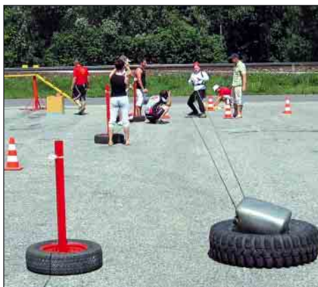
Jedna z náročných súťažných disciplín