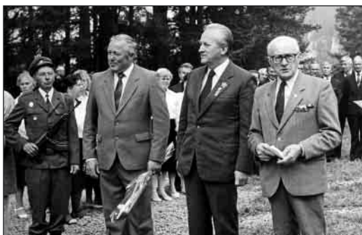
Odhalenia pamätníka v auguste 1989 sa zúčastnil aj Jozef Lenárt (v strede), predseda vlády ČSSR v r. 1963 - 1968