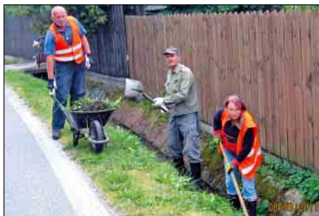
Čistenie rigolu pri Jurášovcoch

V auguste previedli brigádu dve popoludnia pri