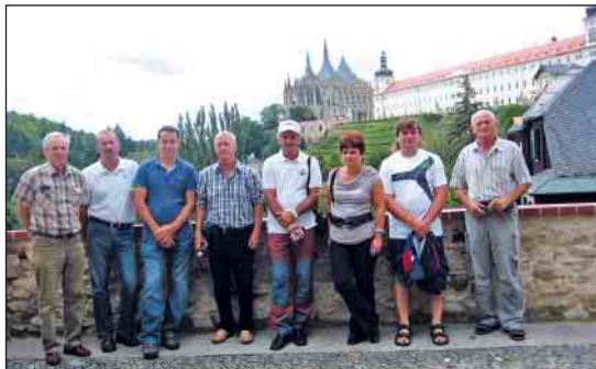
Pred chrámom sv. Barbory v Kutnej Hore

Aj nedeľný program bol pestrý. Začali sme prehliadkou historickej časti Hradca Králové, potom kúpeľov Bohdaneč a múzea českého vidieka na zámku v Kačíně. V Kutnej Hore sme navštívili najstaršiu českú mincovňu a chrám sv. Barbory. Pri spiatocnej ceste sme si prezreli národný zrebčín v Kladruchoch nad Labem, kde chovajú vyšľachtené starokladrubské kone. Popoludní za nami do