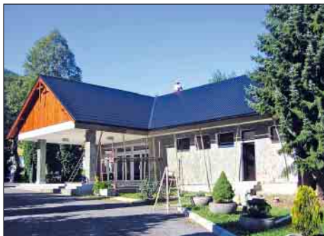
Nadstavba strechy Domu smútku v júli a auguste 2012

Celkový vysúfažený náklad na nadstavbu strechy bol dodávateľom vo výške 17 217,00 € vrátane DPH. Taktiež zo strany Komposesorátu a urbariátu Kráľova Lehota, evanjelickej a rímskokatolíckej cirkvi bola poskytnutá materiálna a finančná pomoc na krov a drevenú konštrukciu strechy (materiál, doprava, porezanie na pile) vo výške 75% nákladov.