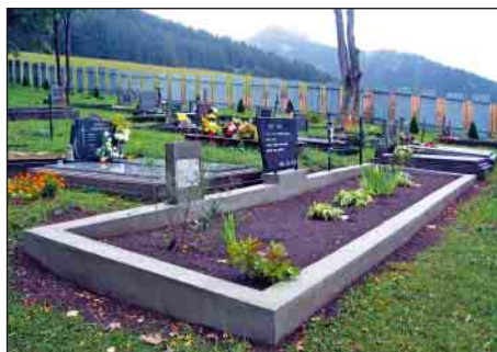
Upravené vojnové hroby na cintoríne

čistení rigolov aj brigádnicu z Campfestu Ranč YFC Svarín, potom aj mladí skauti, za čo im patrí poďakovanie.