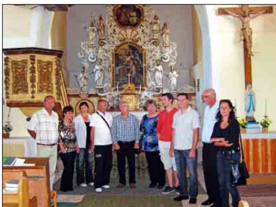
V kostole sv. Žigmunda