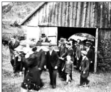
Pohrebný sprievod cez byvalú márnicu

Cintorín mal v minulosti kamennú márnicu s drevenou strechou. Cez márnicu bol priechod, ktorým sa vchádzalo do cintorína, vľavo od priechodu bola miestnosť na uloženie truhly a hrobárovho náradia. V márnici ukladali len nebožtíkov samovrahov a neznámych, ostatní boli do doby pochovania v domoch, v ktorých zomreli. Cintorín mal z prednej a ľavej strany plot z kamenného múra pokrytého strieškou zo šindľu, zadná a pravá strana bola ohradená dreveným plotom.