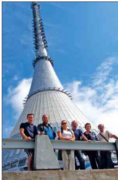
Na vrchole Ještědu nad Libercem

Liberca. Visutou lanovkou sme sa vyviezli na vrch Ještěd. Z Ještědu sme mali nádherný výhľad na mesto Liberec, ale aj na Krkonoše, Jizerské a Lužické hory, Český ráj, časť územia východných Čiech, poľského Dolného Sliezka a nemeckej Lužice. Na Ještěd vedie asfaltová cesta, ktorou je až na samý vrchol povolený vjazd osobnými autami. Visutá lanovka je stále majetkom českých štátnych železníc (ČD), nepredali ju ako u nás lanovky v Tatrách súkromníkom. Prehliadli sme si historický stred Liberca a navštívili zoológickú záhradu. Po návrate do Královej Lhoty sme sa v miestnom pohostinstve zabavili na hasičskej tanečnej zábave.