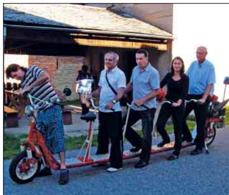
Pred štartom jazdy na kolobežke