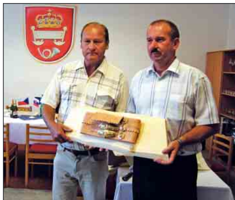
My sme priniesli ako dar pastiersky opasok

V pondelok sme išli do blízkeho Nového Města nad Metují. Prehliadli sme si jedinečné historické námestie, zámok a zámockú záhradu. Námestie je mestskou pamiatkovou rezerváciou, pritom môžu na ňom zadarmo parkovať osobné autá. Po návrate do Kráľovej Lhoty sme si na obecnom úrade navzájom vymenili dary. My sme hosťiteľom priniesli pastiersky opasok, obrázkovú knihu o slovenských horách a darčekové tašky, oni nás obdarovali obrazmi s historickými dobovými obrázkami našej Kráľovej Lhoty a darčekovými taškami.