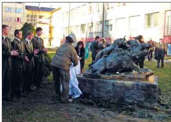
Odhalenie zrekonštruovanej sochy, 15. 11. 2012