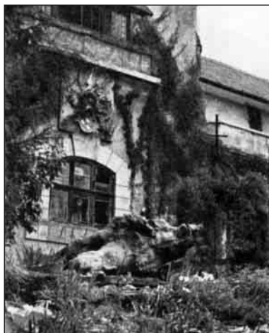
Pred Štróblovou vilou v Kráľovej Lehote, 1955