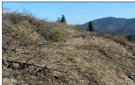
Strážny hrádok 2. Foto marec 2014