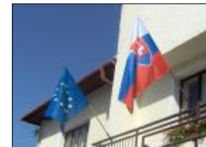
Priechelie Obecného úradu, 2006