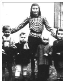
V kráľovlehotskej materskej škole, prvá sprava, 1944

Narodila sa českému staviteľovi cesty Kráľova Lehota - Čertovica, ktorý býval u miestneho gazdu Mrliana v rokoch 1941 - 1945. Potom sa presťahovali do Popradu.