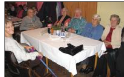
Časť účastníkov posedenia s dôchodcami