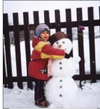
S úsmevom do budúcnosti