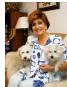
V roku 2002