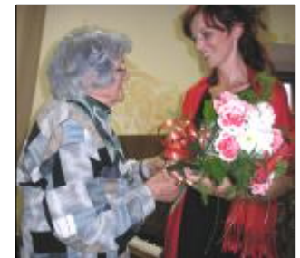
Pri prijímaní gratulácií

K R Á Ľ O V A L E H O T A , obecný časopis. Vychádza štvrťročne. Vydáva Obecný úrad Kráľova Lehota. Redakčná rada: Ing. Jozef Cerovský, Milan Lehotský, Jozef Lesák, Vladimír Kaprini. Redaktor a grafická úprava: František Bizub, 032 33 Kráľova Lehota 164, tel.: 0907 652406, e-mail: bizubf@mag-net.sk . Tlač: REPROservis - DTP štúdio Liptovský Mikuláš. Náklad: 220 kusov.