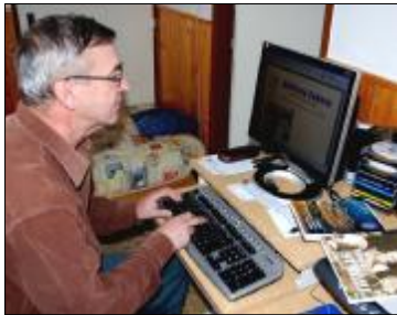
Rodí sa nové číslo časopisu