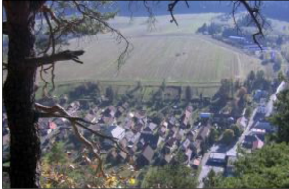
Stred obce z Vachtárovej, okt. 2006