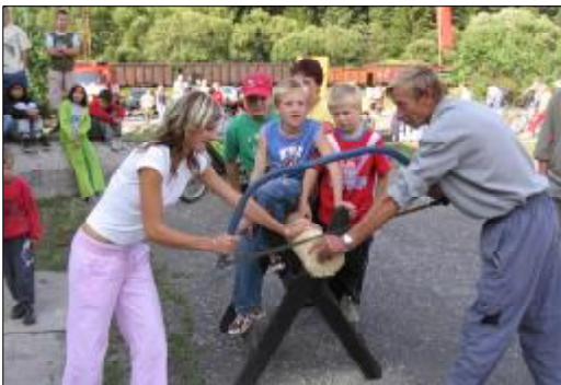
Súťaž v pílení dreva