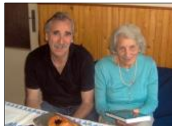
So synom Vilyim, sept. 2006

Mnohí naši rodáci, hoci žijú mimo obce, roztrúsení po Slovensku i v zahraničí, udržiujú s rodiskom kontakty a často sa sem vracajú. Ako sa im vo svete darí a ako si na svoju mladosť spomínajú, budeme uvádzať v tejto rubrike.