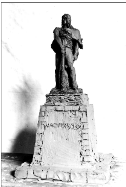
Štróblu návrh sochy Jánošika, 1925

Z rukopisu knihy F. Bizuba Po stopách Alojza Štróbla