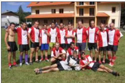
Súťažné družstvo Kráľovej Lehoty