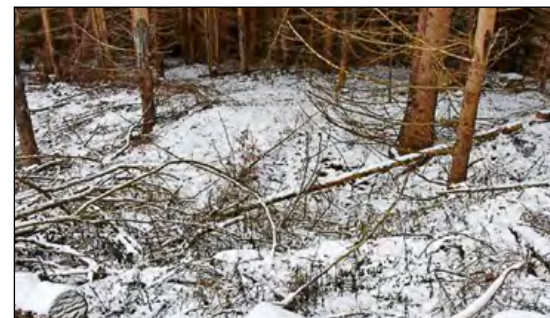
Jama v ktorej stála taviaca piecka na železo

Pri porovnávaní s obrázkami trosky publikovanými v odbornej literatúre som zistil, že troska je taká istá, ako troska z pravekých taviacich piecok v Čečejovciach pri Košiciach, ktoré archeológovia datujú do 6. storočia pred našim letopočtom do neskorkej halštatskej doby. Trosku dám na rozbor odborníkom, aby to potvrdili.