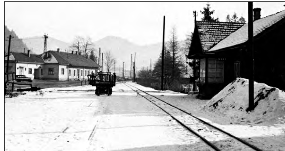
Stanica lesnej železnice v Kráľovej Lehotě, r. 1968 a 1972

Ipolitckú odbočku popri potoku Ipolitica od hlavnej trate v osade Čierny Váh po dolinu Snežná stavali na 3. etapy v rokoch 1925 - 1933 a postupne dosiahla dĺžku 14,4 km v nadmorskej výške 1030 m.