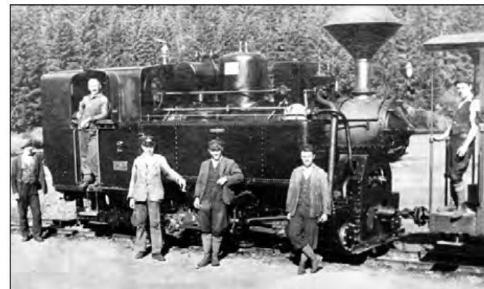
Obsluha vlaku Považskej lesnej železnice, okolo r. 1930

Považská lesná železnica pozostávala z hlavnej trate, ktorá viedla údolím Váhu a Čierneho