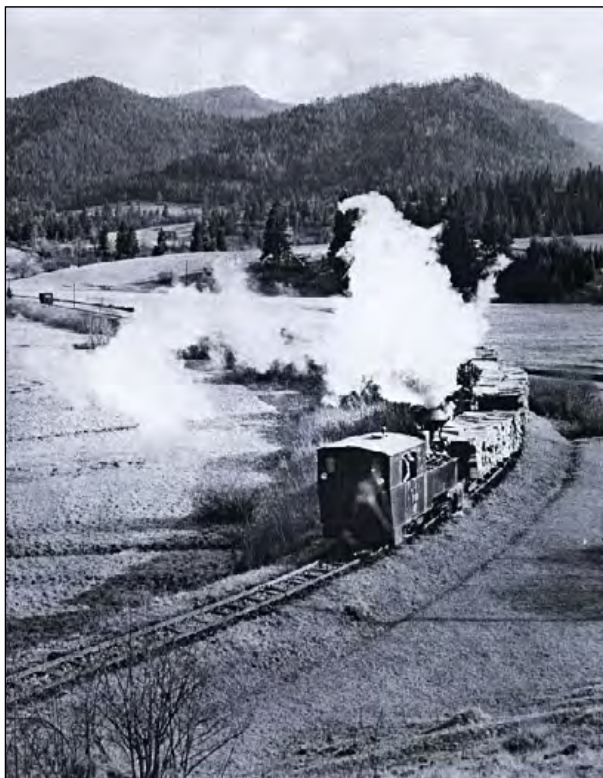
Na druhom závoze nad Kráľovou Lehotou, r. 1968

úsekoch do skál a postupne po dolinu Kremeniny v nadmorskej výške 1021 m dosiahla dĺžku 6,5 km. Odbočka nadväzovala hrotovou úvraťou (zo smeru od Liptovskej Tepličky) na hlavnú trať v km 22. 8. Keďže odbočka bola úvraťová, parný rušeň išiel hore strmým údolím otočený, s komínom vzadu. Mohlo sa stať, že rušeň nebude mať dostatok vody v časti skriňového kotla nad pecou a dôjde k jeho poškodeniu. Preto v roku 1930 v úrovni km 22.4 hlavnej trate postavili točňu, na ktorej pred odchodom do benkovskej odbočky otáčali rušeň komínom dopredu.