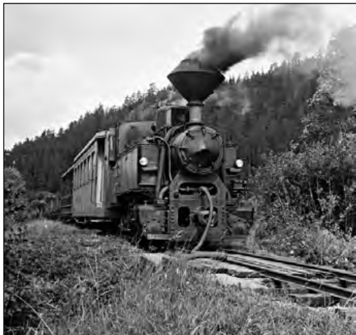
Rušeň berie vodu z Dielskeho potoka na Milkove nad Kráľovou Lehotou, r. 1968

siahla 107 km. Počas 56 ročnej prevádzky bola Považská lesná železnica spoľahlivým dopravným prostriedkom na zvoz dreva aj na prepravu osôb. Výrazne ovplyvnila aj život obyvateľov obcí a osád v nízkotatranských dolinách. Pre Liptovskú Tepličku a doliny Čierneho Váhu bola takmer pol sto-