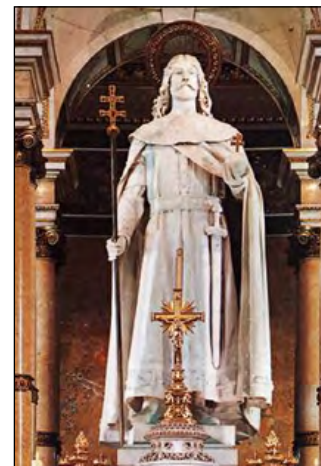
Sv. Štefan na hlavnom oltári od Alojza Štróbla