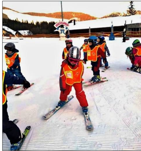
Lyžiarsky kurz v Jasnej, január 2020