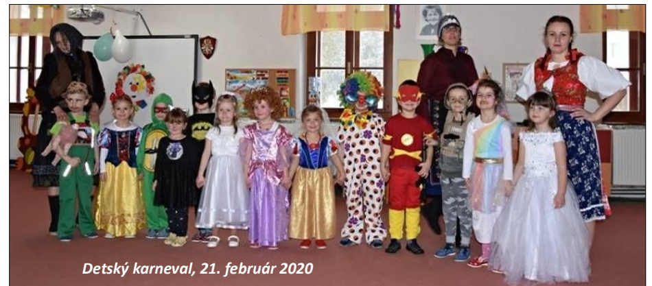
Detký karneval, 21. február 2020