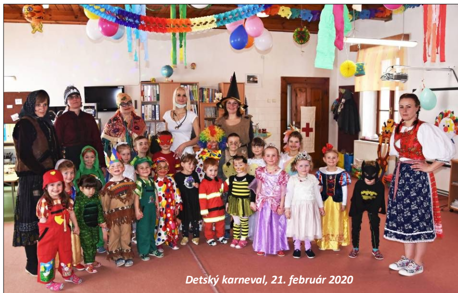
Detský karneval, 21. február 2020