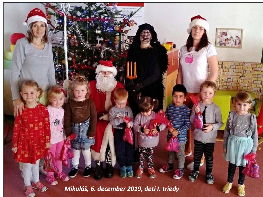
Mikuláš, 6. december 2019, deti I. triedy

Fašiangy sú obdobím radosti, veselosti, plné zábav a hudby. Pre deti sme pripravili veselý týždeň fašiangových aktivít. Prostredníctvom prezentácie a rozhovoru sa deti oboznámili s fašiangovými zvykmi. Spolu s pani učiteľkami pripravovali výzdobu, spievali, recitovali,