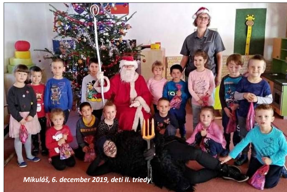
Mikuláš, 6. december 2019, deti II. triedy

tancovali, zdobili priestory MŠ a veľmi sa tešili na očakávaný deň. Keď konečne nastal ten čarovný deň – piatok 21. februára 2020 naša MŠ sa premenila na veselú miestnosť plnú rozprávkových a filmových postavičiek.