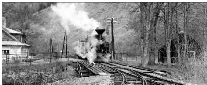
4., 5. Stanica PLŽ v Kráľovej Lehote 6. Cez skalné zárezy nad Svarínom 7. Na stanici PLŽ v osade Čiernom Váhu