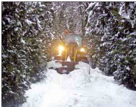
Hlavný chodník na cintoríne