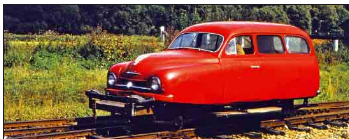
8. Na stanici v Liptovskej Tepličke