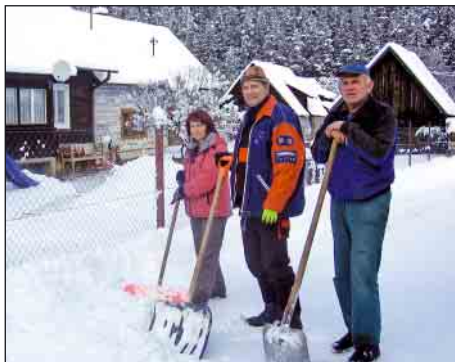
Pracovníci aktivačnej činnosti

zmluvu na dobu určitú, mali snehu už plné zuby a boleli ich z neho ruky. Okrem iného dopĺňali paličkové drevo do kotolní materskej školy a kultúrneho domu a ďalšie nevyhnutné činnosti, za čo im patrí poďakovanie.