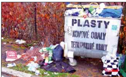
Niektorí občania nedbajú na poriadok v obci. Kontajner v dolnej časti Novej ulice