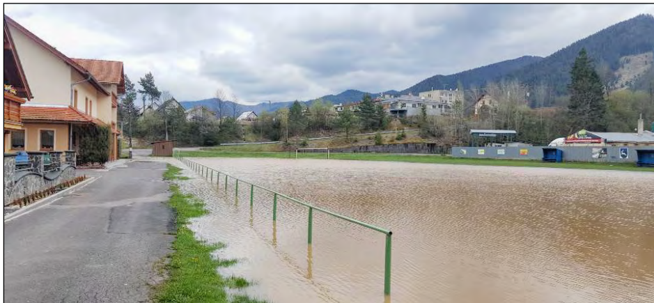
Zaplavené futbalové ihrisko z rozvodnenej Bocianky, 29. 4. 2017