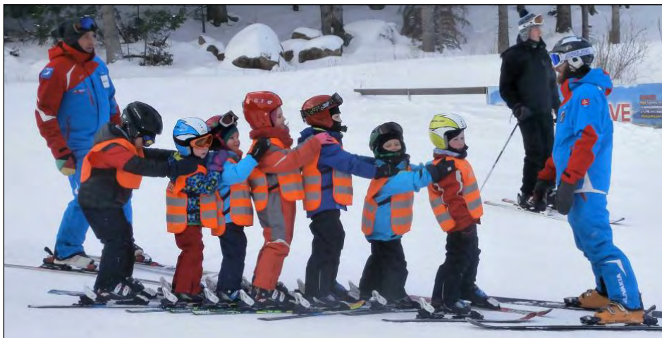
Škôlkári na lyžiarskom výcviku v Jasnej, 18. 1. 2017 U prvákov v Liptovskom Hrádku, 8. 3. 2017