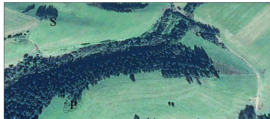
Elipsovité plocha o priemere 35 – 48 m (P) s kamenným pokladom zarastená trnkami a červenými smrekmi na časti hradiska Diel, ktorú chceli odstrániť pred r. 1972. Vľavo hore na Pápernom skupina červených smrekov (S).

Ku podivu nakreslil mi to miesto na Pápernom, kde na satelitnej snímke vidno podzemné základy. Od tohto miesta smerom na juhovýchod nakreslil obdĺžnikovú plochu asi 60 x 80 m, ktorú nemohli kvôli kamennému podkladu orať a preto ostávala zatrávnená. Povedal mi, že roľníckemu družstvu to, že nemohli orať naraz celú veľkú plochu poľa, prekážalo časovo aj ekonomicky. Preto okolo roku 1982 roľnícke družstvo odtiaľ kamene vyberalo pomocou nakladačov Hon a odvážalo, nevedel mi povedať kam. Povedal, že to neboli bežné poľné vápencové kamene a okruhliaky, ale to boli ľudmi opracované kamene, také aké teraz vidíme na múroch niektorých starých domoch v dedine. Teraz sa táto plocha asi 60 x 80 m už tiež môže orať, jej stred má GPS 49° 0' 45.83" N, 19° 48' 12.21" E. Teda túto časť podzemných základov starej dediny vtedy zničili, ale našťastie zostali vedľa podzemné základy, ktoré vidno na satelitnej snímke z roka 2003.