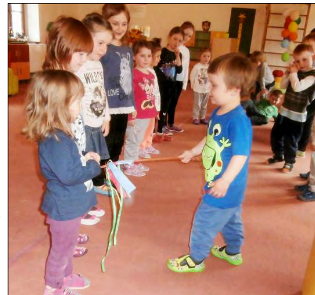
Veľkonočná šibačka, 13. 4. 2017