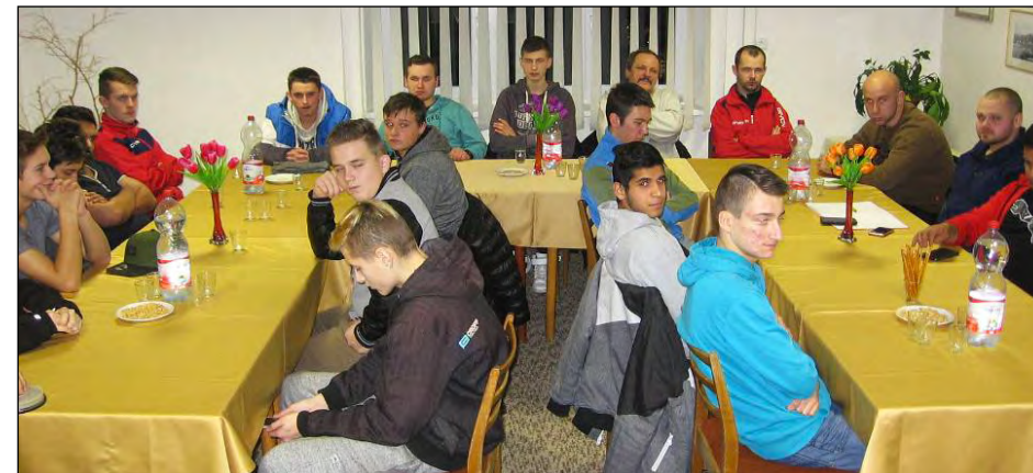
Výročná členská schôdza FK Kráľova Lehota, 14. 1. 2017