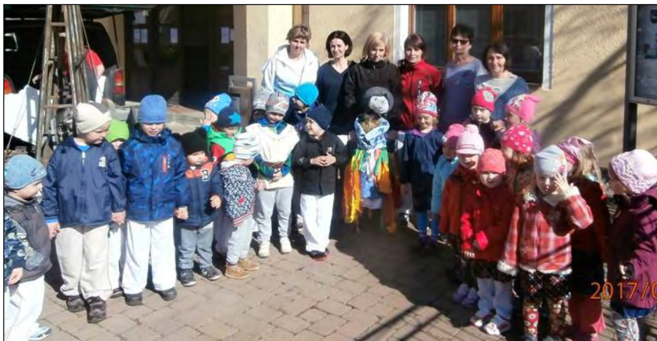
Hádzanie Moreny do Váhu, 29. 3. 2017

Začiatkom februára sa tohtoročná tuhá zima podpísala aj na vysokej chorobnosti detí, dôsledkom čoho bol znížený počet detí a následné prerušenie prevádzky materskej školy na 4 dni.