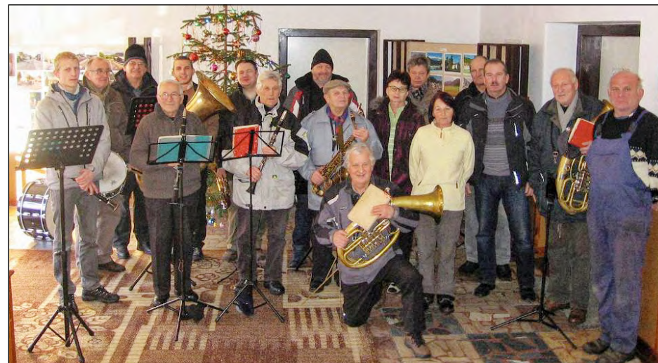
Novoroční vínšovníci z Liptovského Hrádku, 2. 1. 2017