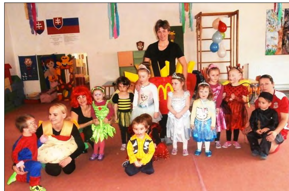
Karneval mladších detí, 23. 3. 2017