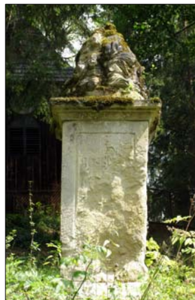
Pamätný stĺp z r. 1804