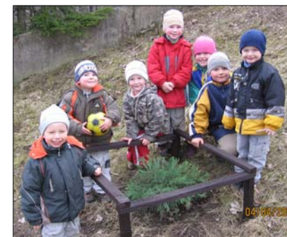
Nech deti i stromček rastú ako z vody