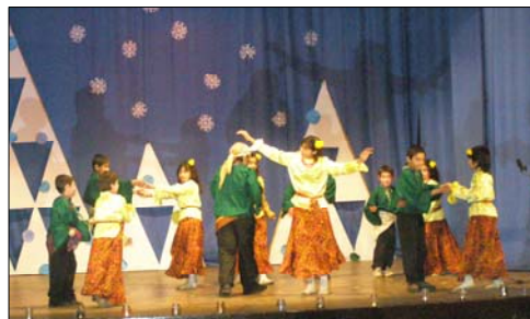
Na Vianoce 2007 v Kultúrnom dome v Hybiach