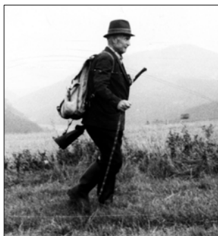
Hore Záhumním na poľovačku

V liptovskohrádockom semenárskom závode zriadil laboratórium na zisťovanie kvality semien, robil pokusy so zaklíčováním semien pomocou stimulátorov a s dlhodobým skladovaním smrekového semena. Založil 7 ha provienčnej pokusnej plochy smrekovca na Podbansku,