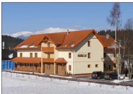
Južná strana penziónu

Tel.: 044 5224500, 0903 955278 E-mail: info@penzionlarion.sk Web: www.penzionlarion.sk 0903 307640